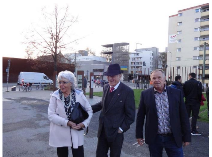
Bernauer Straße/ Besichtigung der Gedenkstätte